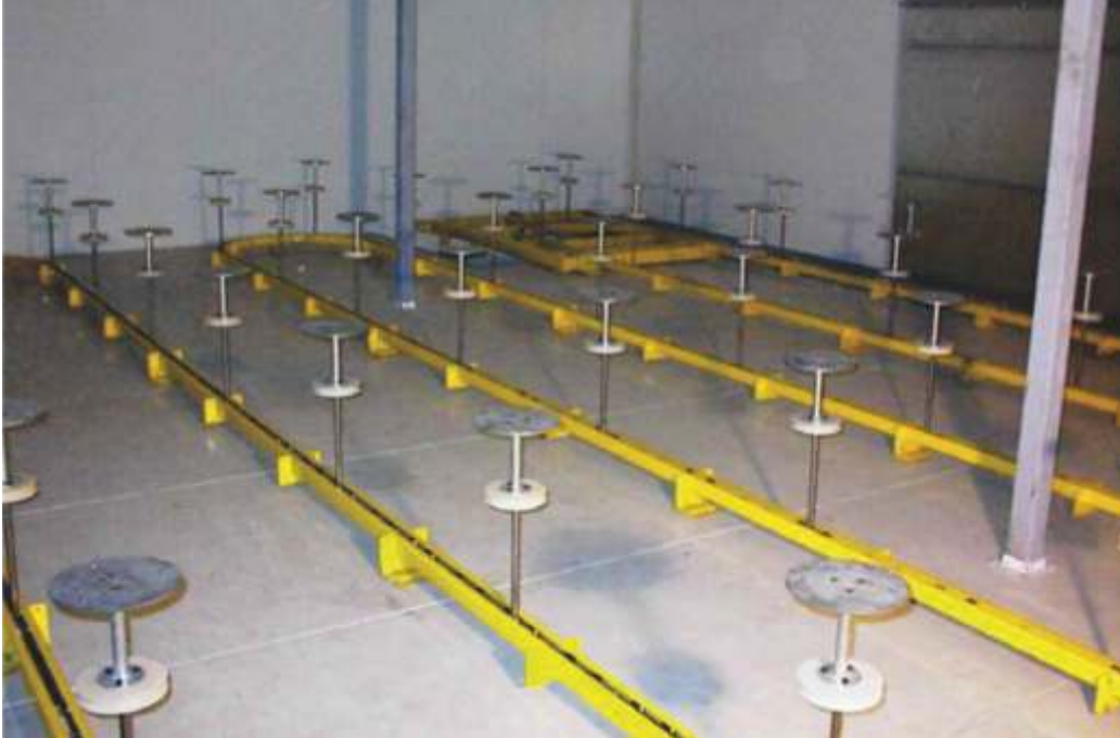
Alsópályás konvektor gyártása, szerelése