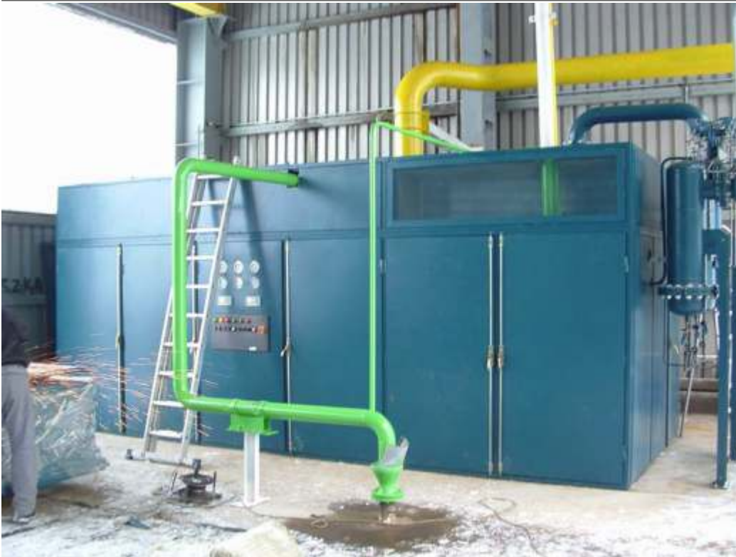
Kompresszor alappozatok (levegő, gáz, hűtő), hangszigetelő burkolatok