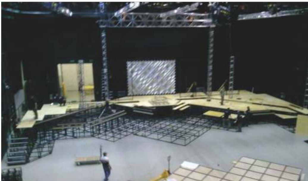
Széf - gépészet