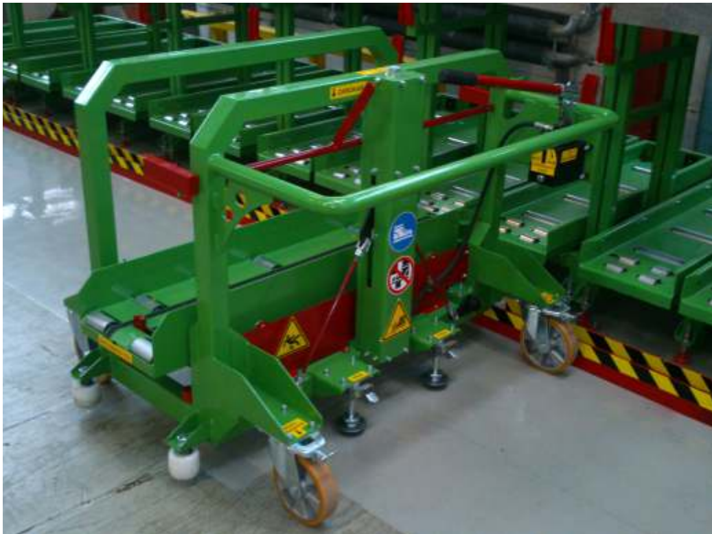
Penny Market elosztó központok