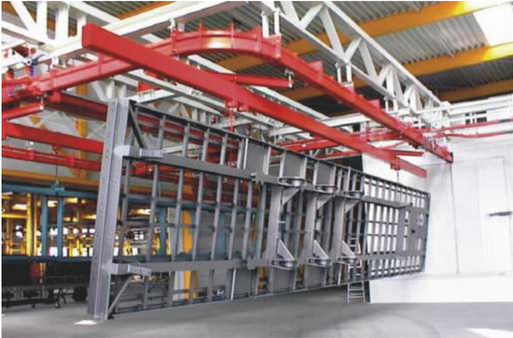
Nehéz kétpályás konvektor gyártása, szerelése