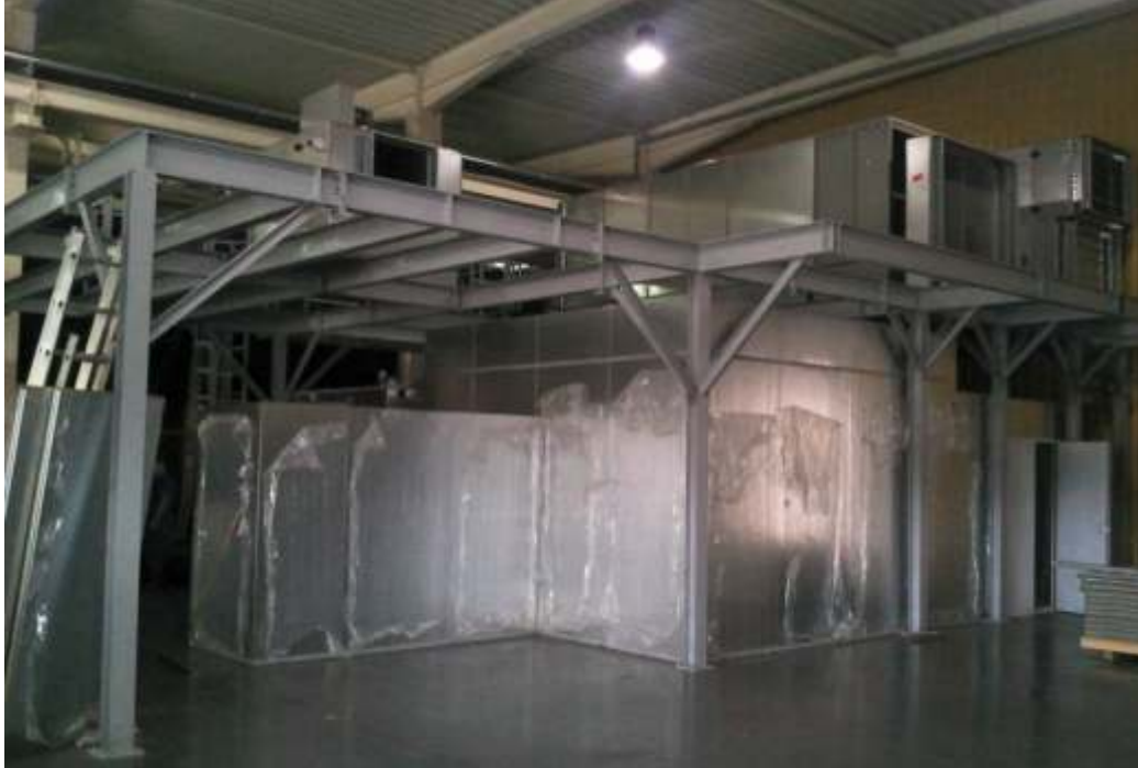
Festőüzemi kiszolgáló sorok, gépészeti tartószerkezetek