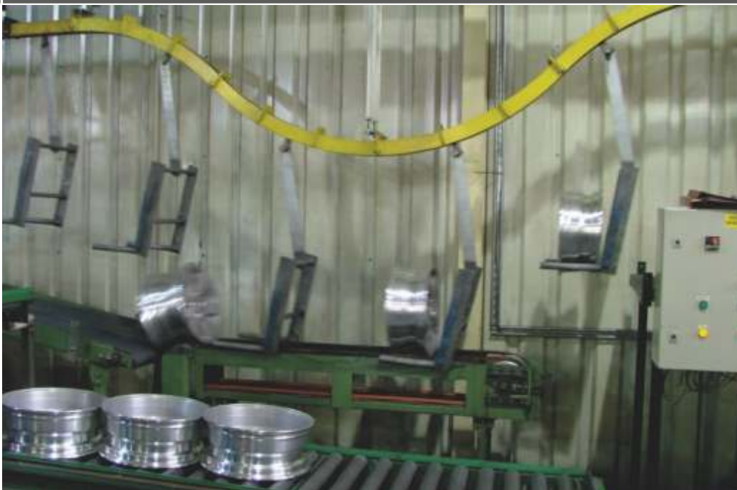
Öntősori és megmunkáló sori konvektorok gyártása, szerelése Keréktárcsa feladó-leszedő berendezések gyártása Különböző görgős pálya rendszerek gyártása, szerelése