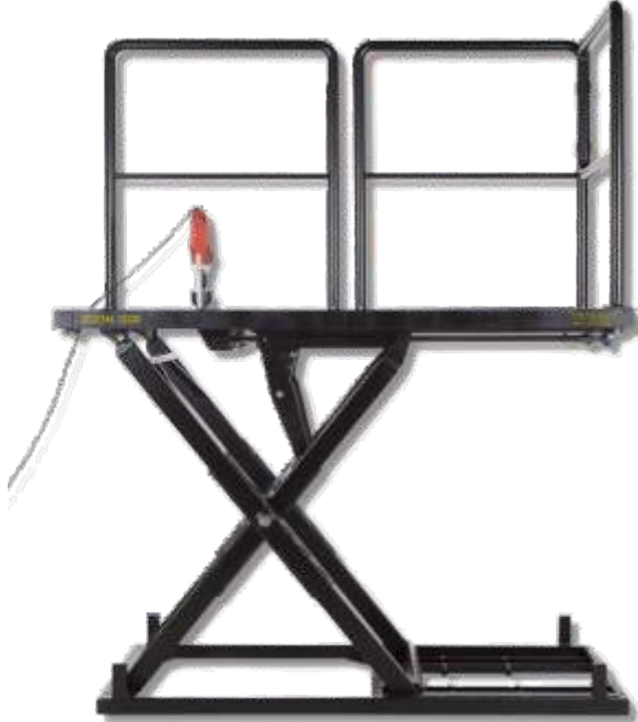
Színpadi ollós emelők . Színpadtechnikai gépek, berendezések