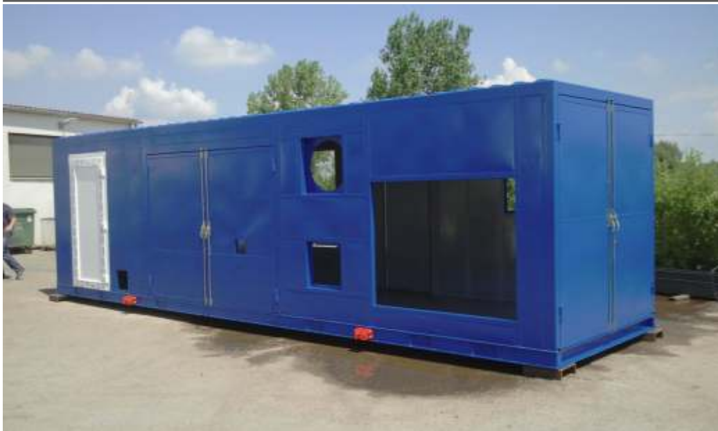
Egyedi méretű, speciális konténerek