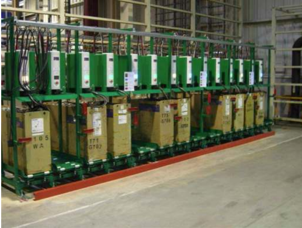
AUDI Motor Kft., Győr;