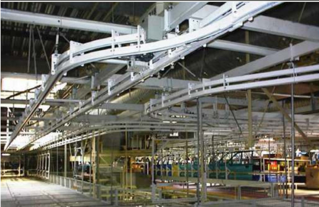
Ajtőszerelő kétpályás konvektor gyártása, szerelése Ajtó leszedő-feladó manipulátorok gyártása, szerelése