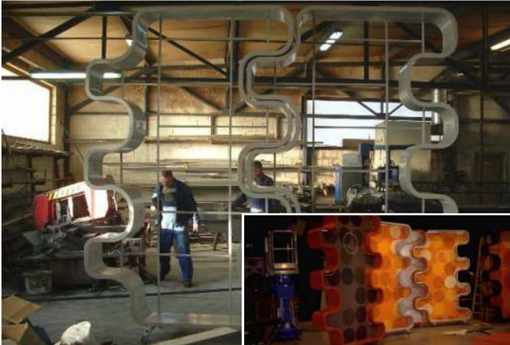
X Faktor – Kalandra fal komplett színpad és gépészet